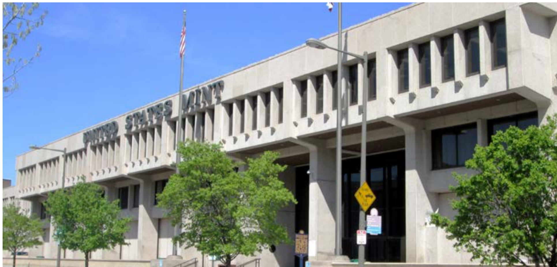
La Casa de la Moneda en Estados Unidos donde ha llegado el oro ilegal del Clan del Golfo