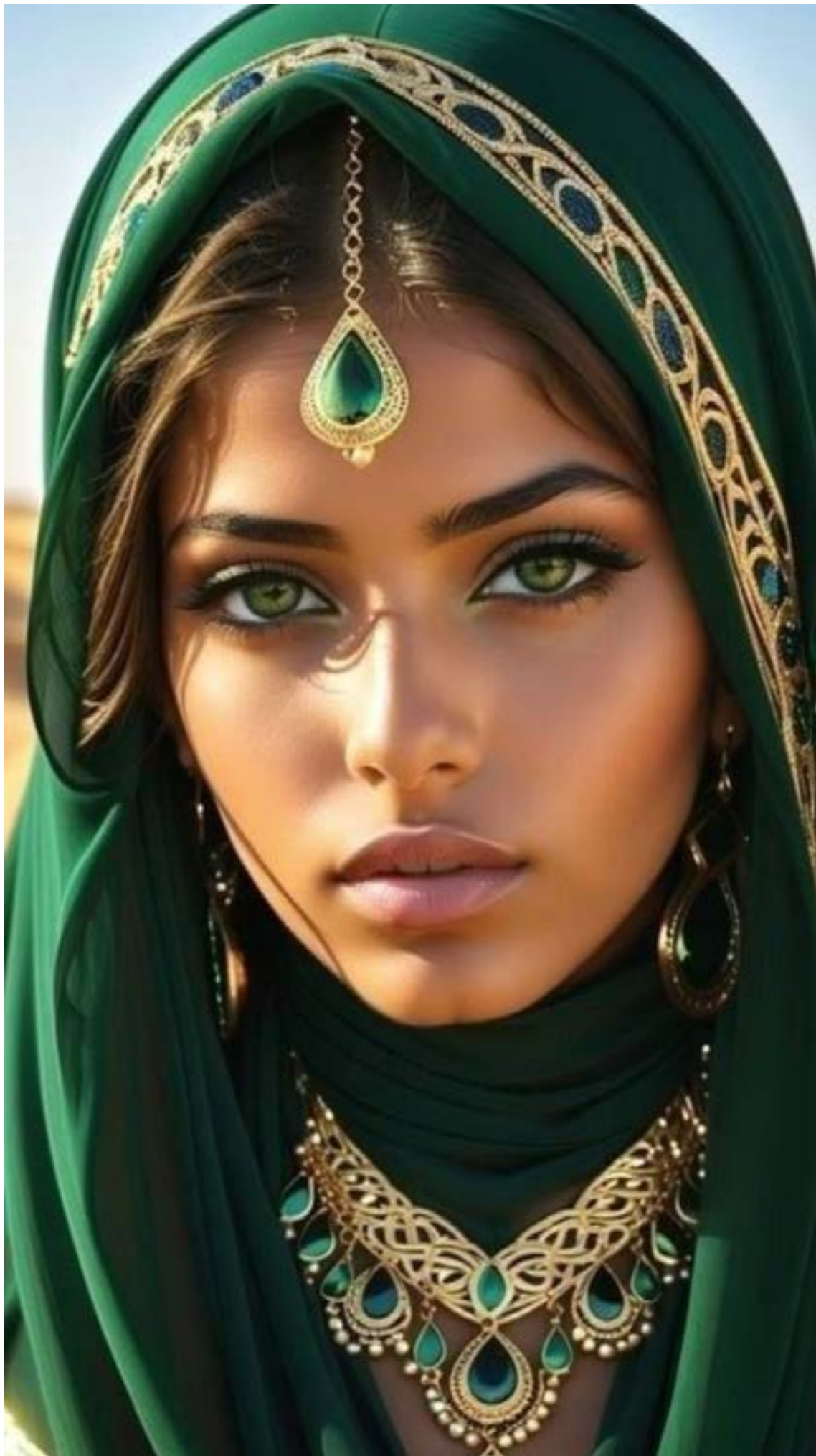
«La mirada del desierto»

El «Tropitour» de Karol G: «La Bichota» sigue rompiendo récords de taquilla. Agotó en cuestión de horas las entradas para sus tres conciertos de diciembre en Bogotá y se mostró «incrédula» ante el apoyo masivo de su público. Además, figura como nominada en diversas categorías