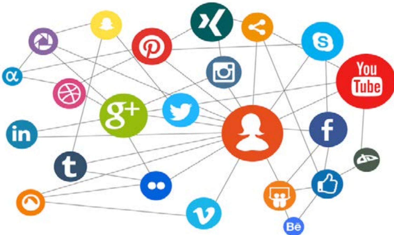
Las redes sociales

sap diariamente, vuelvo a respirar hondo y tenga que auto compensarme valorando que esta columna va por @eljordario en X , en Spreaker y en Youtube y con mi nombre en Face y en Telegram y la república