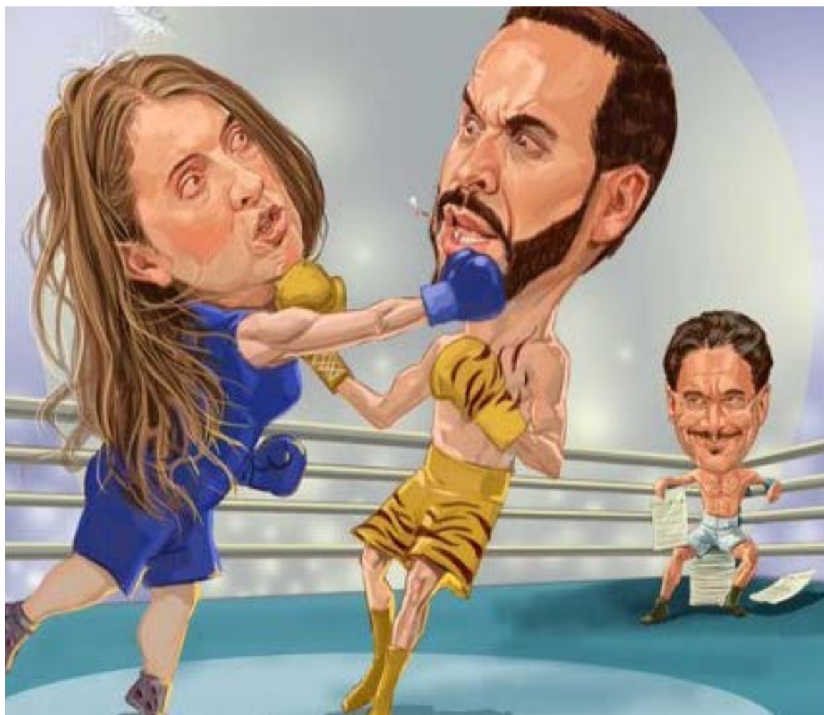
Encuesta de CAMBIO y el CNC: Paloma pierde impulso, Abelardo remonta y Cepeda los mira desde arriba. Ilustración de Jorge Restrepo.

Paloma le gana a de la Espriella en Antioquia y empató con Cepeda. Pese al fuerte respaldo de la maquinaria de Fico Gutiérrez a De la Espriella, Paloma Valencia logra derrotarlo en Antioquia al consolidar un