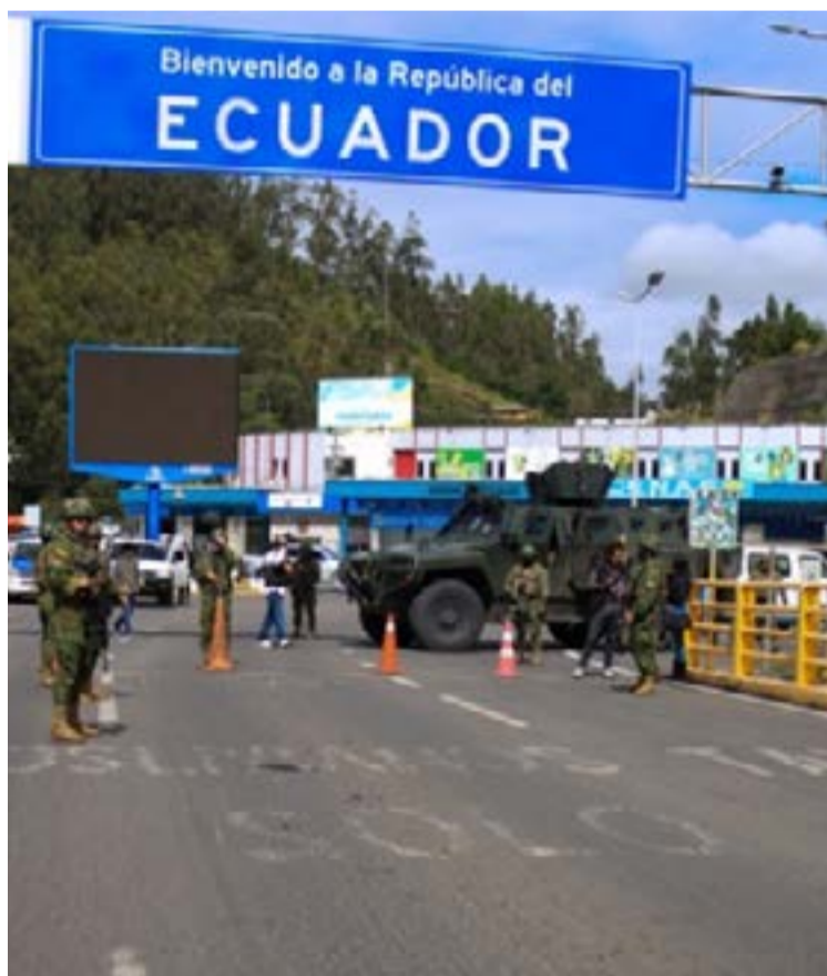
Petro sostuvo que tanto en Colombia como en el exterior, sectores de extrema derecha promueven discursos de confrontación para desestabilizar procesos de paz y afectar la solidez democrática. Para el mandatario, estas acciones forman parte de una maniobra de aislamiento internacional dirigida a empañar la imagen del país ante la comunidad global.

Petro sostuvo que tanto en Colombia como en el exterior, sectores de extrema derecha promueven discursos de confrontación para des-