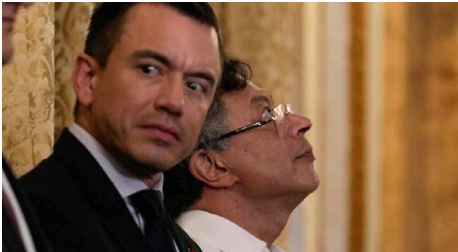
Petro denunció una alianza entre Noboa y la extrema derecha colombiana, liderada por Álvaro Uribe, para desestabilizar su gobierno mediante el miedo. Según el mandatario, esta estrategia busca estigmatizar su gestión con narrativas de inseguridad para influir en los próximos resultados electorales.

La reducción significativa de cultivos ilícitos.